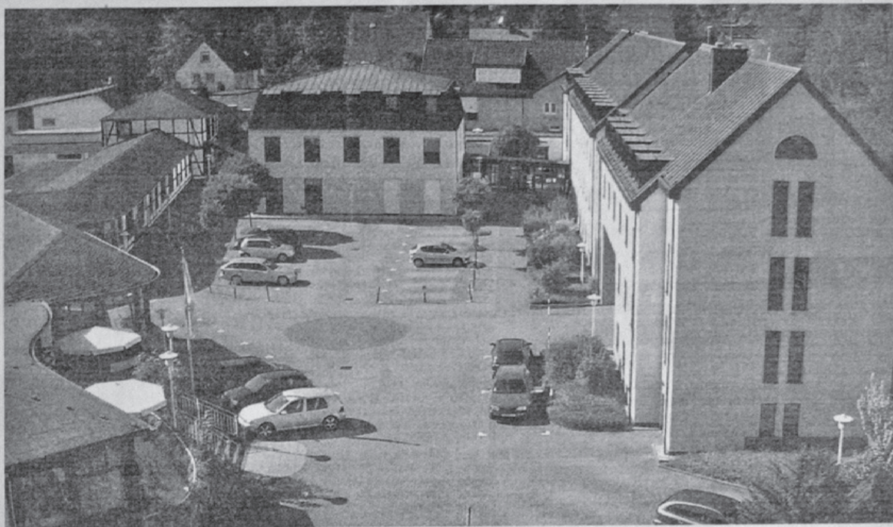
Um einen Innenhof (Bild links) gruppieren sich zwischen dem Markt und der Monschauer Straße die zum Tagungszentrum gehörenden Bauwerke. Bekannter ist die Ansicht des ehemaligen „Eifelkern“ (Bild unten) von der Innenstadt aus.

„Drei Sterne superieur“, antwortet Klaus Müller mit vornehmer Zurückhaltung auf die Frage, in welche Kategorie er das Haus einstuft. Ein Blick in die Anlage lässt ahnen, dass der Trend eher in Richtung vier Sterne geht. Wobei die Preise eher im niedrigen Bereich angesiedelt sind. Das Einzelzimmer mit Frühstück